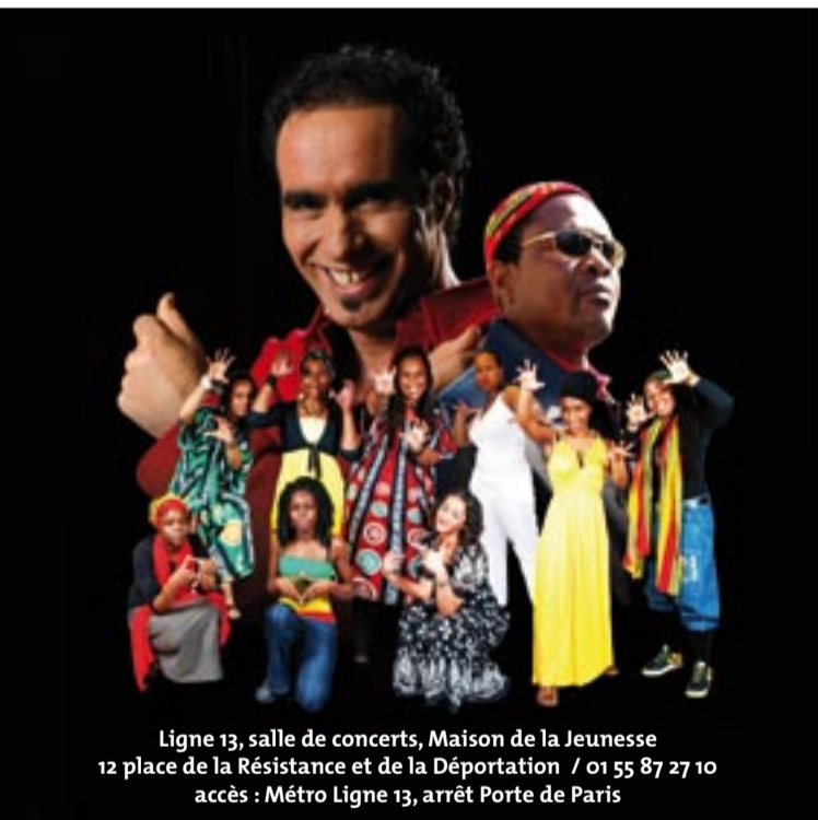
Ligne 13, salle de concerts, Maison de la Jeunesse 12 place de la Résistance et de la Déportation / 01 55 87 27 10 accès : Métro Ligne 13, arrêt Porte de Paris